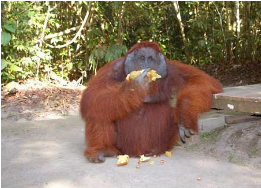
suaugęs patinas Camp Leakey je

Šios stovyklos vardas suteiktas žymaus pasaulinio lygio mokslininko archeologo Louis Leakey garbei, kuris padėjo įgyvendinti trijų moterų, Jane Goodall, Dian Fossey ir Birute M. Galdikas, troškimą studijuoti didžiąsias žmogbeždžiones jų natūralioje aplinkoje. Vėliau šis trejetas pradėtas vadinti Leakey's Angels (Leakio Angelai).