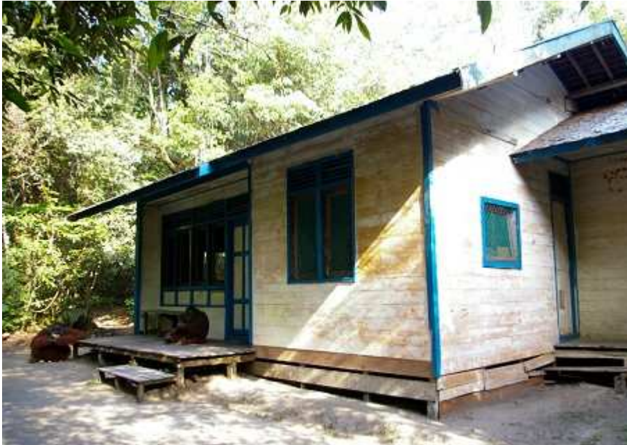
prof. B. Galdikas namas